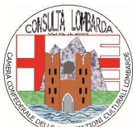
Consulta Lombarda Camera Confederale Assoc. Culturali Lombarde